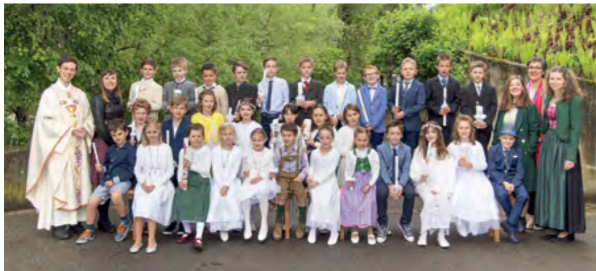
Voll Freude haben 30 Mädchen und Buben der Volksschule Berliner Ring ihre Erstkommunion gefeiert. Bei den Treffen und Gottesdiensten in der Vorbereitungszeit waren sie voll Begeisterung dabei und haben so die Pfarre gut kennengelernt.