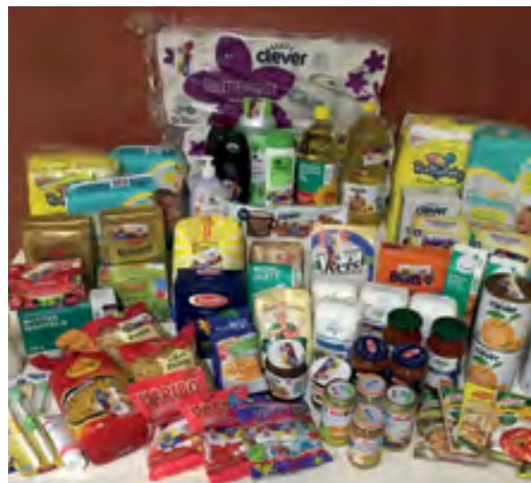
Herzlichen Dank dem Lions Club „Graz Schlossberg“ für 33 große Schachteln mit Lebensmitteln und Toiletteartikeln!! Mitglieder des Clubs sammelten und stellten die Spenden der Vinzenzgemeinschaft zur Verteilung an Bedürftige in unserer Pfarre zur Verfügung.